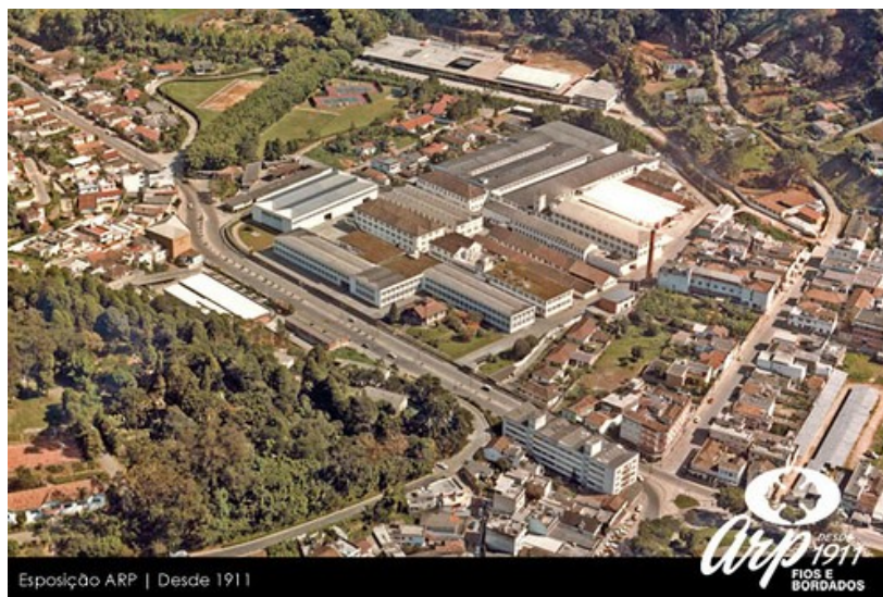
Ilustração 3. Fábrica de Rendas ARP Década 80.