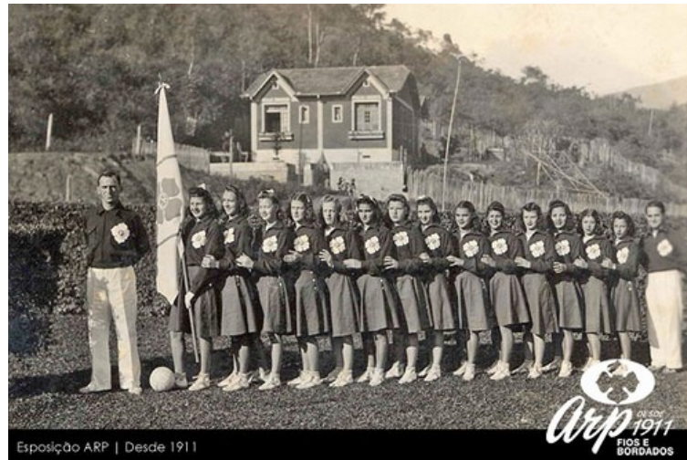
Ilustração 1. Time de Vôlei Feminino da Fábrica de Rendas Arp. 1937.

Além disso, a ocupação de Nova Friburgo foi também feita por homens livres, muitos dos quais imigrantes e filhos de imigrantes (alemães e suíços), em sua maioria camponesa, posseira e agregada. Viviam na “ brecha da economia agro-exportadora ”, atuando na produção de alimentos ou em pequenas atividades urbana ligadas ao comércio decorrente da instalação de estação da estrada de ferro (Menezes, 2008) e da colonização helvética-alemã