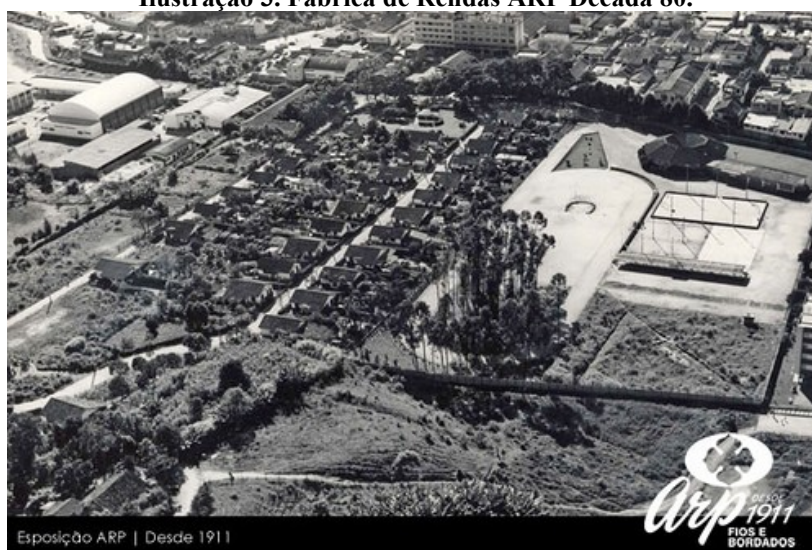
Ilustração 4. Uma das Vilas Operárias da ARP a esquerda, com colégio ao fundo e um centro recreativo a direita. Destruído na enchente de 1997.