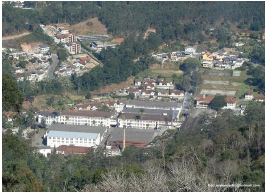
Ilustração 6. Filó (Triumph)