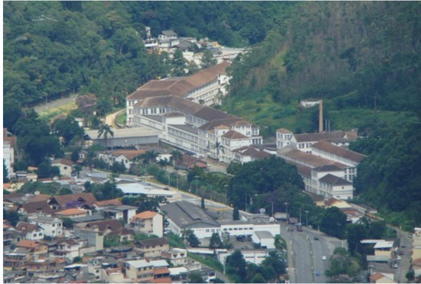
Ilustração 5. Ypu