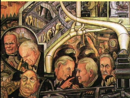
Diego Rivera • Guanaajuato-MEX: 1886 • Cidade do México-MEX: 1957 "INDÚSTRIA MODERNA" • 1933